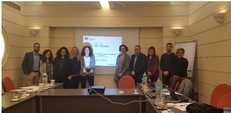
Photo of our last Staff meeting in Athens in March

Los socios tendrán la próxima reunión en Perugia el 12 de noviembre de 2019.